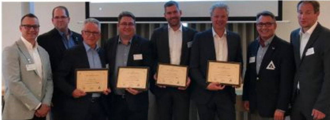
Die ersten deutschsprachigen „Certified Healthcare CIOs“ wurden auf dem Kongress „Krankenhausführung und digitale Transformation“ ausgezeichnet.

Nächste CHCIO Prüfungsvorbereitung und Prüfung zw. dem 14.-16.10.2019. Anmeldeschluß: 07.10.2019