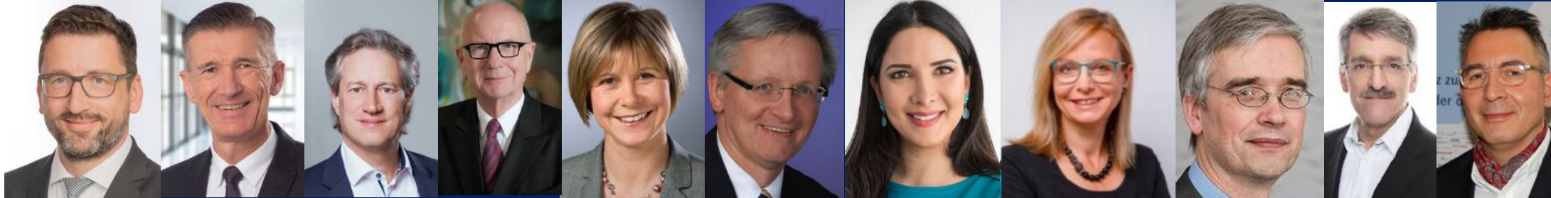
Vorsitzende, Feedbackgeber, Wahlteamleitung, Moderatoren und Sommer-Camp Gastgeber